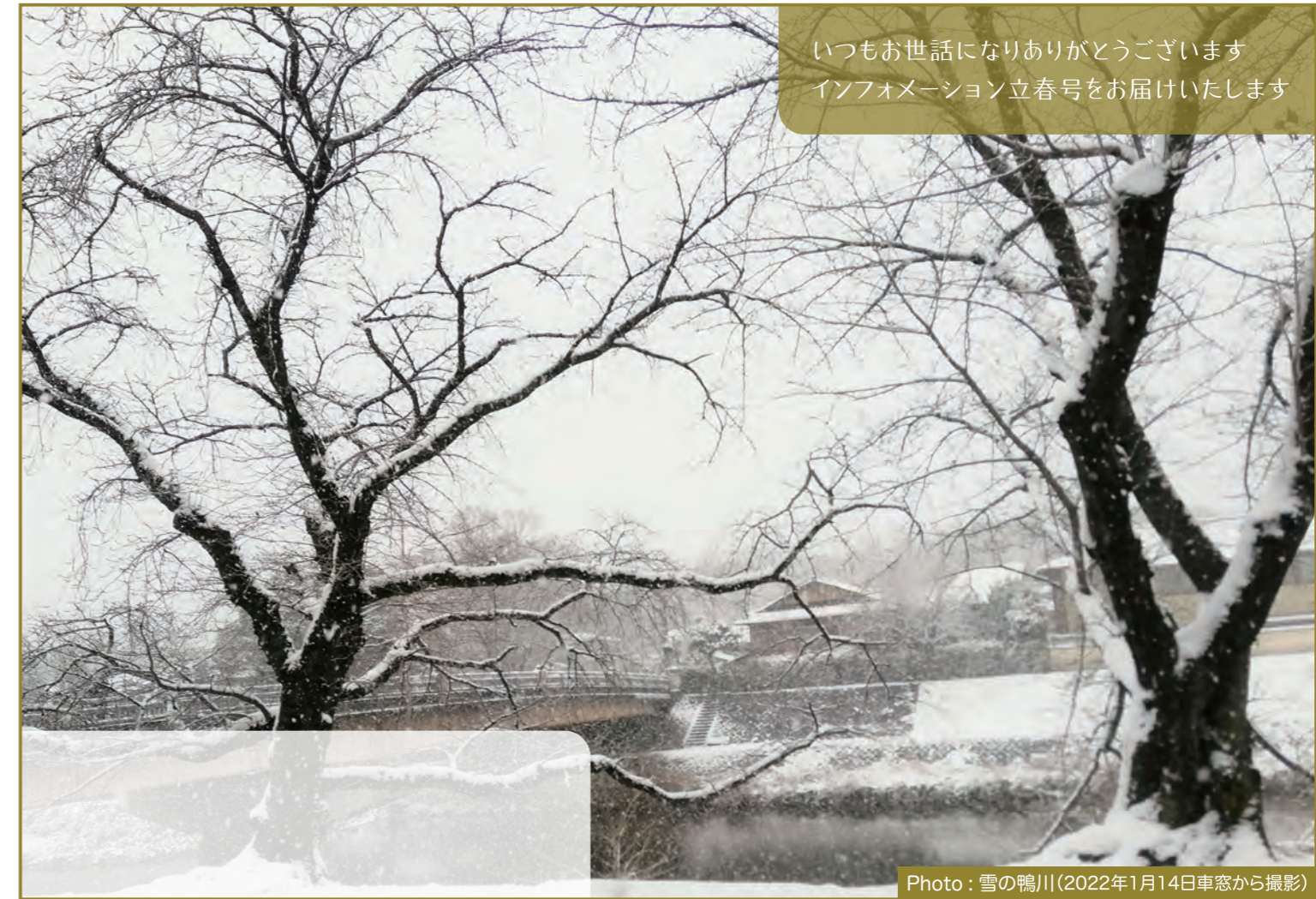
いつもお世話になりありがとうございます インフォメーション立春号をお届けいたします