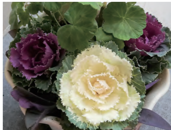
→ 葉牡丹を植えました