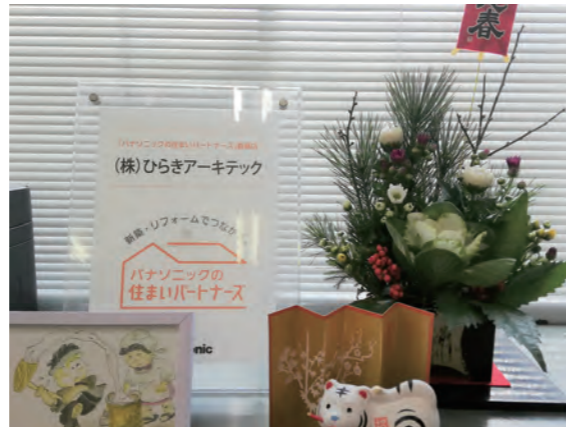
→ お正月を迎えました