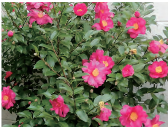
← さざんかが咲きました